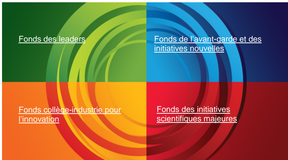
Figure 2.1 – Principaux programmes

La description des principaux programmes, des partenariats stratégiques et des autres programmes se trouve sur le site Web de la FCI, à la section Fonds ( www.innovation.ca/fr/Fonds ).