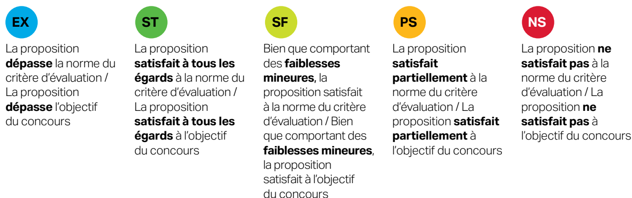
Figure 2: Échelle d'évaluation de la FCI

Une cote « ST » indique qu'une proposition satisfait à l'objectif et répond à la norme qui lui est associée.